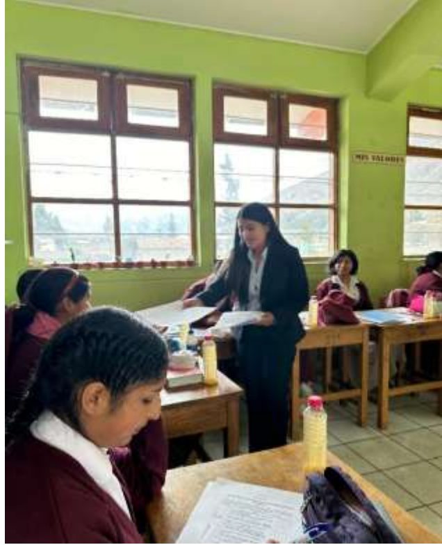
Imagen 1 y 2 : aplicación del instrumento a estudiantes del 3ro A de la Institución educativa Nuestra Señora de Lourdes, Pampas Tayacaja